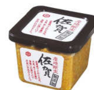
For the Tasty Century Miyajima