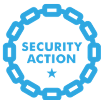
セキュリティ対策自己宣言