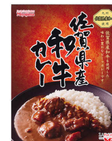
For the Tasty Century Miyajima